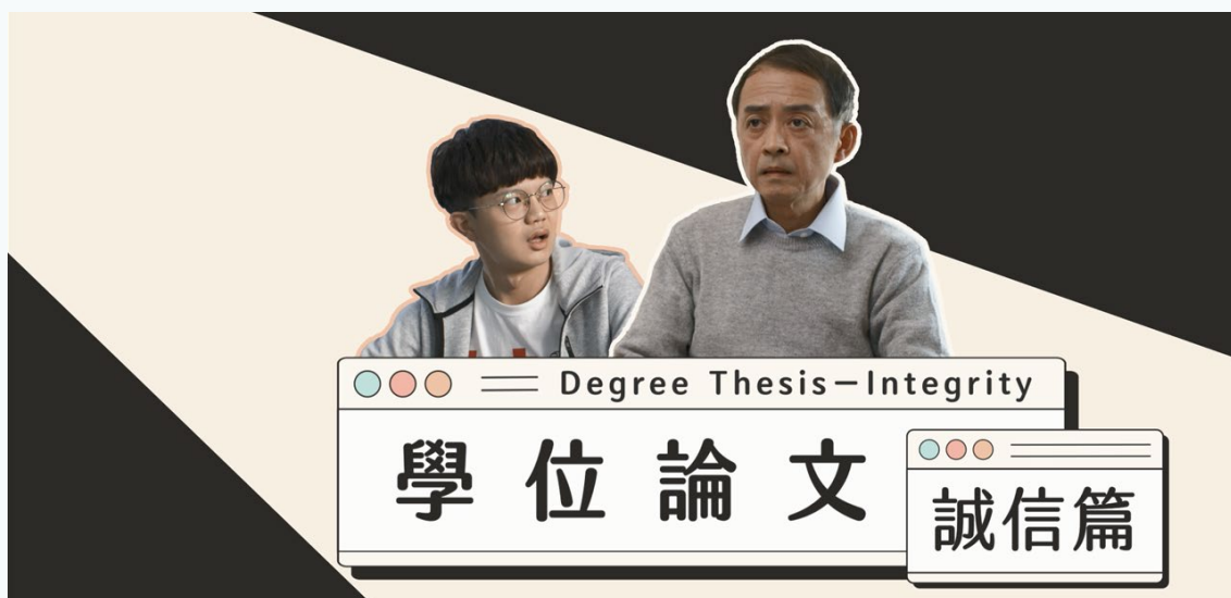
圖三 學位論文—誠信篇（取自影片截圖）

最後，運用檢核表也是個不錯的方法。去年有一群國際著名的學術倫理學者，在 Nature 期刊發表了關於學術出版品的完整性檢核表（圖四；詳見參考資料第 9 筆）。該表囊括作者列名、抄襲、倫理、資料完整性與成果報告等 11 個面向的查核。建議大學校院與指導教師將該檢核表應用於學術倫理自律的相關機制中，如此能在投稿前，針對師生學術著作是否符合普世學術倫理規範，進行最後的把關。