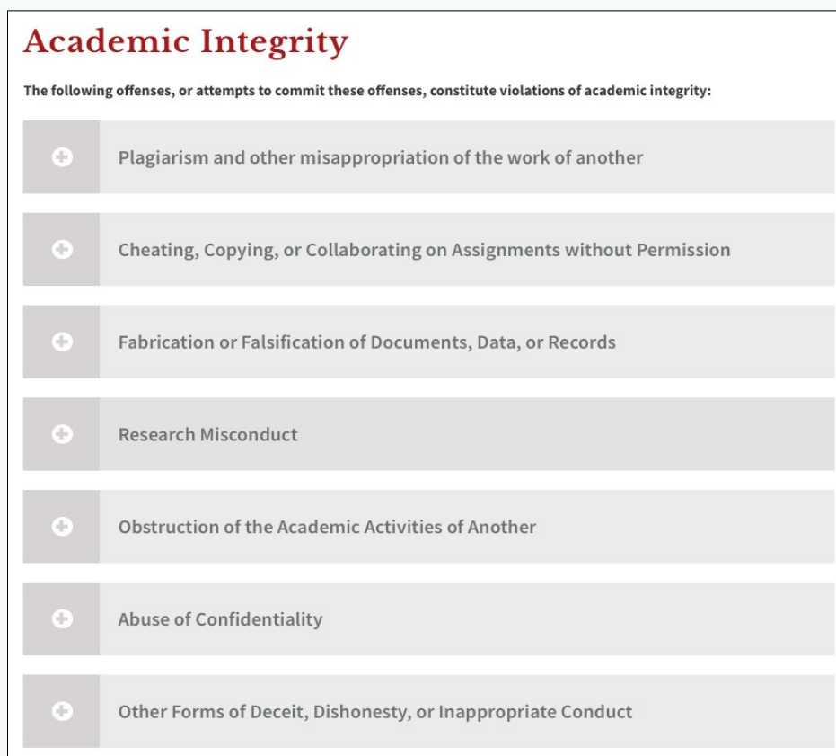
圖一 Brown School 對違反學術誠信的定義（取自其官網）

另以加州大學聖地牙哥分校（University of California San Diego）為例，該校設有專門處理學術誠信事務的單位 Office of Academic Integrity（OAI），並以教育推廣作為他們的首要任務。OAI 每學期都會舉辦多元的教學活動，一方面深化校內師生與助教在教學與修課時的學術誠信知能，另一方面也藉此彰顯學校對於學術誠信的重視。該校甚至每年會培訓多名學生間的同儕教育者（peer educators），透過青年學子間的創意與溝通語言（漫畫、插畫、動畫與影片等）去推廣學術誠信；這些學生也會參與違反學術誠信學生的輔導工作。此外，該校為了深化學術誠信，使之成為一種校內文化，每年都會舉辦 Integrity Awards，分別表揚對學術誠信、研究誠信具有貢獻的師生。當然，OAI 這個專責辦公室也是一個師生與助教對疑似作弊情事（cheating；如考試作弊、代考、代寫作業、抄襲、冒名點名等）的正式通報管道（圖二）。